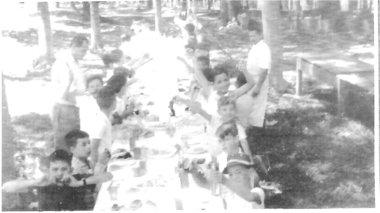
Foto 5. – Quase em frente ao Gama, o Stricagnolo.